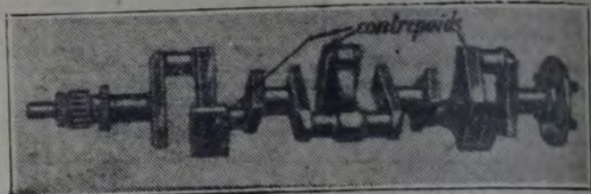
Fig. 3. — Cigüeñal compensado de auto Delage, 6 cilindros

La dificultad de hacer funcionar silenciosamente un motor es mucho más grande para los grandes motores que para los pequeños y esto es lo que hace el problema difícil. Los grandes motores son precisamente los motores de lujo, a los que se exige el funcionamiento más silencioso. Son numerosos los sistemas que se emplean para disminuir o suprimir el ruido de los pistones de aluminio; vamos a indicar aquí los principales. Para los motores más pequeños (menos de 60 ó 65 milímetros